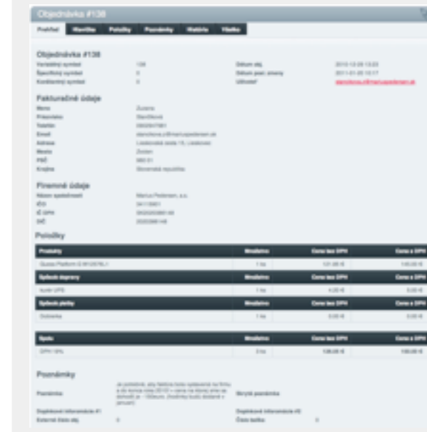
Detail objednávky v administračnej časti s možnosťou úpravy detailov a položiek objednávky