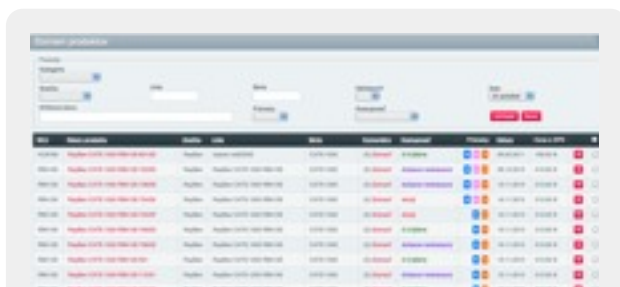
Zoznam tovarov v administračnej časti s možnosťou vyhľadávania a filtrovania tovarov